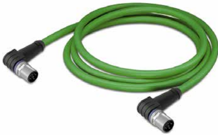
M12 D-kodiert Stecker